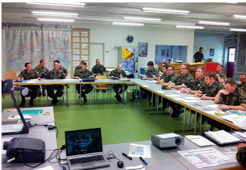
Abb. 2: Entschlussfassungsrapport mit den unterstellten Kommandanten.

In diesem Szenario muss die Flab gleichzeitig zwei Anforderungen gerecht werden. Erstens plant und führt die Luftwaffe die Luftverteidigung. Zwischen der Flab und den eigenen Fliegerkräften erfolgt zwangs-