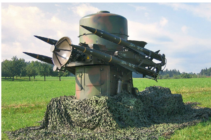
Abb. 3: Eine Feereinheit RAPIER in Stellung.

Der Kommandant der Flab K Gr 2 erhielt den Befehl am Montag, 14.00 Uhr, mit allen Mitteln feuerbereit zu sein. Jetzt galt es, die Truppen in den Einsatzraum zu verschieben und die befohlene Feuerbereitschaft zu erreichen. So musste beispielsweise die L Flab Lwf Abt 1 (Stinger) aus dem Raum Grandvillard in den Raum Utzensdorf verschieben, um ihr Dispositiv zu beziehen. Nachdem es einem ersten gegnerischen Luftangriff gelang, Ziele im Bereitschaftsraum des mechanisierten Verbandes anzugreifen, verlangte der Kdt Einsatzverband Boden (EVB) einen so schnell wie möglich verbesserten Allwetterschutz zu Gunsten der Panzerbrigade. Dank der seriös vorbereiteten Eventualplanung war die Flab K Gr 2 in der Lage, den verlangten Schutz rasch und umfassend anzupassen. Für viele Feu-