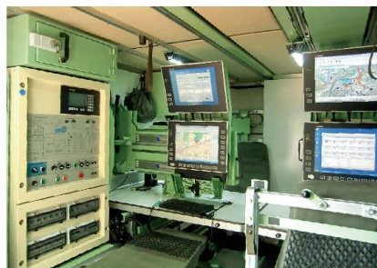
FIS HE in einem Führungsfahrzeug.

für die Entwicklung und Innovation zugunsten der gesamten Gruppe verantwortlich. Highlight ist die gegenwärtig laufende Weiterentwicklung des schweizerischen LOS R-905 von 8 Mbps Bandbreite auf neu 155 Mbps. Mit diesem Quantensprung besetzt Thales und spe-