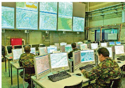
FIS HE im Führungsraum.

Parallel zur Software ZODIACO/TAURO werden bei der Thales Suisse zwei weitere wesentliche FIS HE Applikationen für die Schweizer Armee entwickelt.