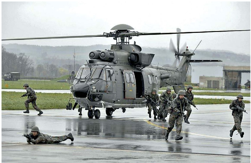
Heer und Luftwaffe im Teilstreitkräfte übergreifenden Einsatz.

So mussten auch die Masseinheiten im Flugdienst gemäss den internationalen Normen standardisiert und der zivilen Luftfahrt angepasst werden. Weltweit werden Höhenangaben und Flug-