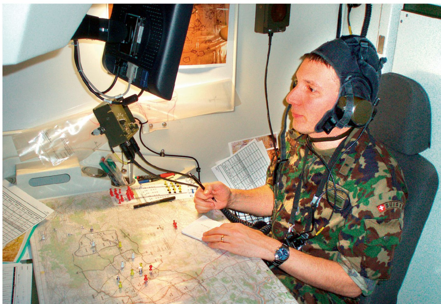
Führung ab Bataillonsführungsstafel.

Simulation. In der Ausbildung geht es vor allem um die zeit- und lagegerechte Entschlussfassung und Befehlsgebung sowie die Auftragstaktik in der Gefechtsführung. In Abhängigkeit der Leistungsfähigkeit der Bataillone können in den Simulationen