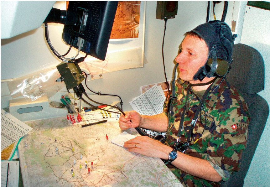
Führung ab Bataillonsführungsstafel.

Simulation. In der Ausbildung geht es vor allem um die zeit- und lagegerechte Entschlussfassung und Befehlsgebung sowie die Auftragstaktik in der Gefechtsführung. In Abhängigkeit der Leistungsfähigkeit der Bataillone können in den Simulationen