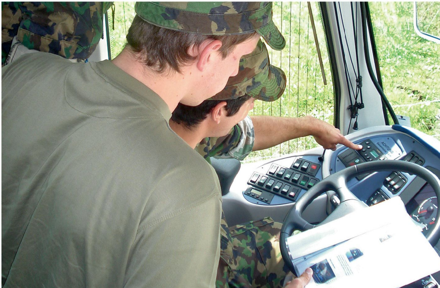
Ausbildung neuer Chauffeure für das Armeespiel.

Bühne aufzustellen ist. Sogar für Auslandseinsätze werden unsere Fahrer vorbereitet, damit sie auf einer Auslandsreise möglichst selbstständig handeln können. In den letzten zwei Jahren war die Militärmusik in England, Frankreich, Deutschland, Niederlan-