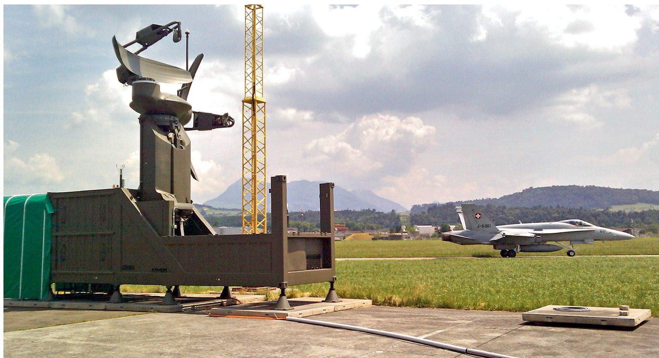
Rundsuchradarsystem (ASR), Primär- und Sekundär-Rundsuchradar (Evaluation)

ortet, identifiziert und meldet Luftfahrzeuge in niedrigen und mittleren Flughöhen und erstellt eine lokale Luftlage, die dem Flugverkehrsleiter im Kontrollturm zur Verfügung gestellt wird. Das Rundsuchradarsystem ergänzt das Luftlagebild von FLORAKO im Bereich der lokalen Flugplätze.