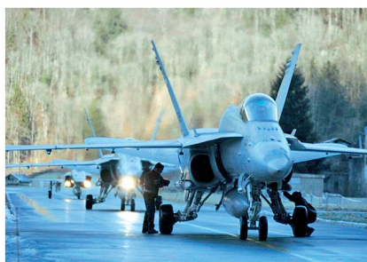
F/A-18 auf dem Taxiway.

Das System MALS setzt sich aus Primär- und Sekundär-Rundsuchradar, Präzisionsanflugradar sowie Flugfunkpeiler zusammen, welche durch den Generalunternehmer Cassidian (eine Unternehmung von EADS) integriert werden. Zu-