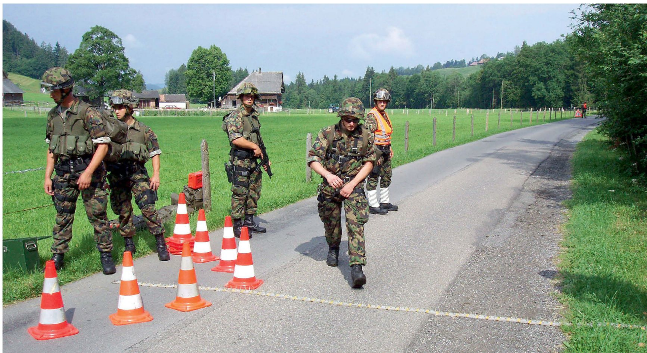
Nagelgurte am Check Point.

zen. Verlangsamen von Zielfahrzeugen beziehungsweise offensiven Fahrzeugen der Gegenseite, zum Beispiel Lastkraftwagen, auch Lastwagen oder Camions mit unkonventioneller Spreng- oder Brandvorrichtung (IED: improvised explosive devices). In temporären und oder kurzfristigen Objektschutzeinrichtungen besteht das Ziel, Fahrzeuge an der Weiterfahrt sofort zu hindern respektive die Weiterfahrtstrecke zu limitieren.