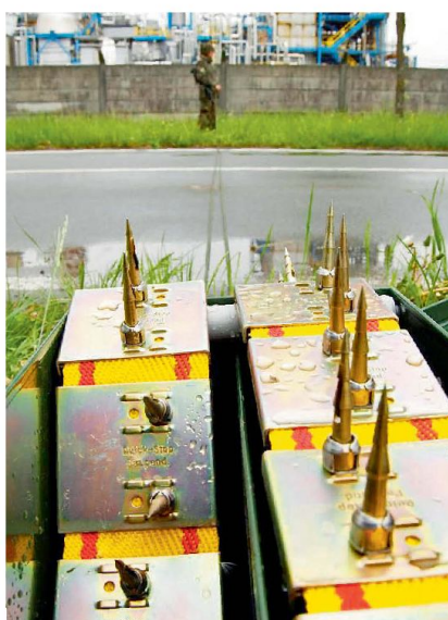
Nagelgurte im Einsatz.

Bei der Infanterie wird das Strassensperrensortiment ebenfalls seit langer Zeit multi-