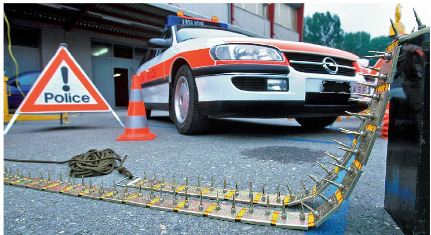
Nagelgurte bei der Mil Sich.

Das bei der Schweizer Armee verwendete Strassensperrensortiment wird bei den Berufs- und Milizformationen der Mi-