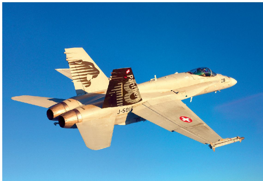
Der bewährte F/A-18 im Einsatz.

Essentiell ist es also, dass moderne Kampfflugzeuge für ein grosses Weiterentwicklungspotential ausgelegt sind. Andererseits müssen auch die Hersteller und/oder die unterstützende Industrie selbst über die gesamte Lebensdauer hinweg in der Lage sein, Anpassungen zu akzeptablen Kosten vorzunehmen. Im Allgemeinen gilt, dass Upgrades für sämtliche Systeme der gleichen Art durchgeführt werden, also für die