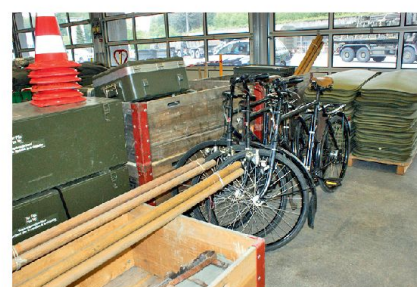
Die Erstfassung der Truppe basiert auf der stationären Logistik.

Der Projektbericht aus dem Pilotversuch in Othmarsingen liegt vor. Die Partner innerhalb der LBA sowie jene ausserhalb wurden für Stellungnahmen einbezo-