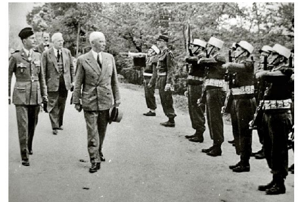
General Guisan schreitet im Jahre 1951 in Sétif (Algerien) eine Ehrenformation der Fremdenlegion ab.

Schweizer Legionären gab der General Guisan folgenden Rat: «Erfülle deine vertraglich vereinbarte Dienstpflicht und melde dich bei deiner Rückkehr den Schweizer Behörden.»