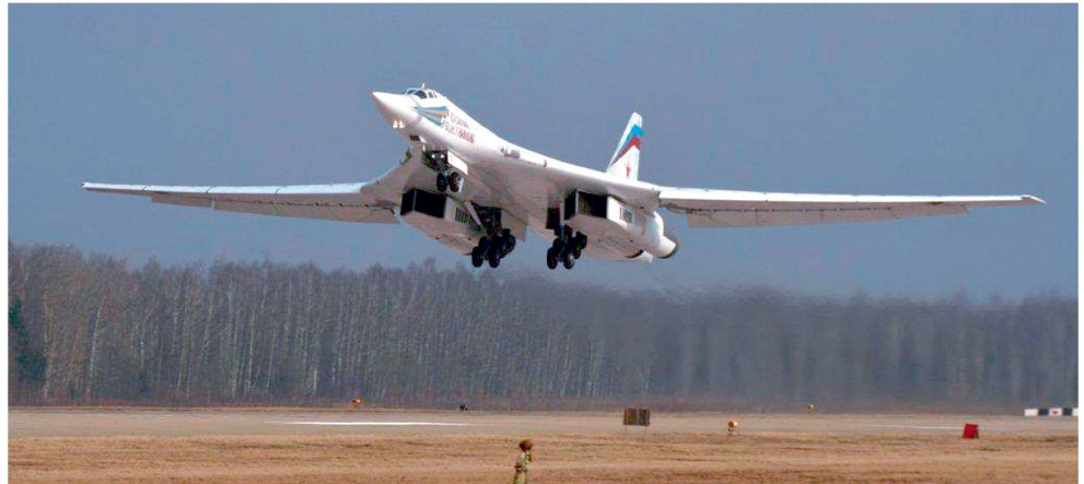
Strategischer Bomber Tu-160 «Blackjack».

Gemäss Aussagen des Kommandanten der 37. strategischen Luftarmee will Russland in den nächsten Jahren einen neuen Bomber mit strategischer Reichweite entwickeln. Dieser soll dereinst die heute im Einsatz stehenden veralteten Tu-95MS «Bear H» und später auch die Tu-160 «Blackjack» ersetzen. Mit der Entwicklung des «zukünftigen Flugzeugkomplexes für die Langstreckenfliegerkräfte» (Abkürzung: PAK DA) wurde das Konstruktionsbüro Tupolev beauftragt. Mit konkreten Entwicklungsarbeiten soll allerdings erst nach entsprechenden intensiven Abklärungen etwa im Jahre 2015 begonnen werden. Der Bau eines Prototypen könnte etwa ab 2017 erfolgen und für die Indienststellung der ersten Maschinen wird ein Zeithorizont von 2025