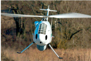
Unbemannter Helikopter «Camcopter S-100».

Die Firma Schiebel mit Sitz in Wien ist Weltmarktführer für Minensuchgeräte und hat in den letzten Jahren für Aufklärungszwecke den unbemannten Helikopter «Camcopter S-