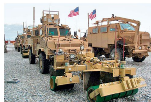
Räumrollen an MRAP-Fahrzeugen.

zung zur Explosion gebracht. Für den Einsatz in Afghanistan wurden zudem eine Steuerung der Rollen, verstärkte Bremsen