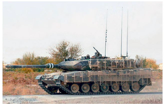
An Kanada wurden modifizierte «Leopard 2A6» geliefert.

Verkauf von Kampfpanzern «Leopard 2» und zum Teil auch «Leopard 1» aus Überbeständen der Bundeswehr. Neben der Türkei, Portugal und Griechenland haben in letzter Zeit auch Kanada, Brasilien sowie Chile deutsche Panzer beschafft. Die exportierten Kampffahrzeuge werden vorwiegend durch die deutsche Rüstungsindustrie generalüberholt und auf Wunsch der Kunden entsprechend modernisiert.