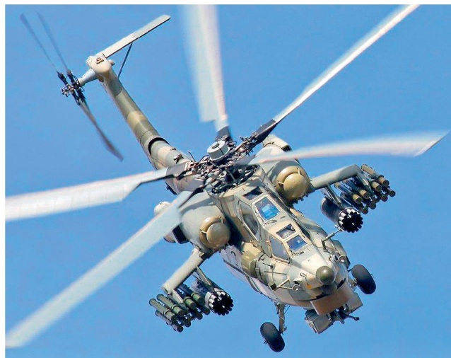
Mi-28N bewaffnet mit Raketenpods und Lenkwaffen AT-9.

Mit der Zuführung neuer Kampfhelikopter der Typen Mi-28N «Night Hunter» und Ka-52 «Alligator» soll in den nächsten Jahren die Ausrüstung der russischen Heeresfliegerkräfte schrittweise erneuert werden. Heute stehen dort immer noch mehrere hundert der veralteten Kampfhelikopter Mi-24 «Hind» in den verschiedensten Versionen im Einsatz. Eine wichtige Rolle soll künftig der neue Mi-28N übernehmen, der als Unterstützung der Heerestruppen im Kampf der verbundenen Waffen eine Hauptrolle spielen soll. Deshalb ist nebst der Automatenkanone 30 mm und diversen Raketenpods auch eine Bewaffnung mit Luft-Boden Lenk-