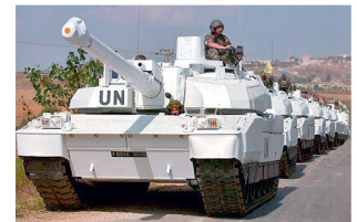
Kampfpanzer «Leclerc» bei der UNIFIL im Libanon.

Hauptstützpunkte konzentriert werden. Andererseits zeichnet sich ab, dass Frankreich aus politischen und wirtschaftlichen Gründen bestrebt ist, seine Militärpräsenz in Asien auszubauen.