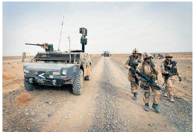
Niederländische Patrouille mit Aufklärungsfahrzeug «Fennek».

über den Rückzugsplan der vier stationierten Kampfflugzeuge F-16 und der fünf Kampfhelikopter «Apache» sowie des entsprechenden Luftwaffenkontingents (rund 500 Mann) herrscht noch Unklarheit.