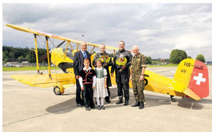
Erste Landung in Emmen und 70-jähriges Jubiläum.

flugplatzes wieder aufgenommen, das EMD lehnte jedoch das Gesuch des Stadtrates Luzern 1948 ab. Bereits 1946 war die Hauptpiste auf 1100 m verlängert worden.