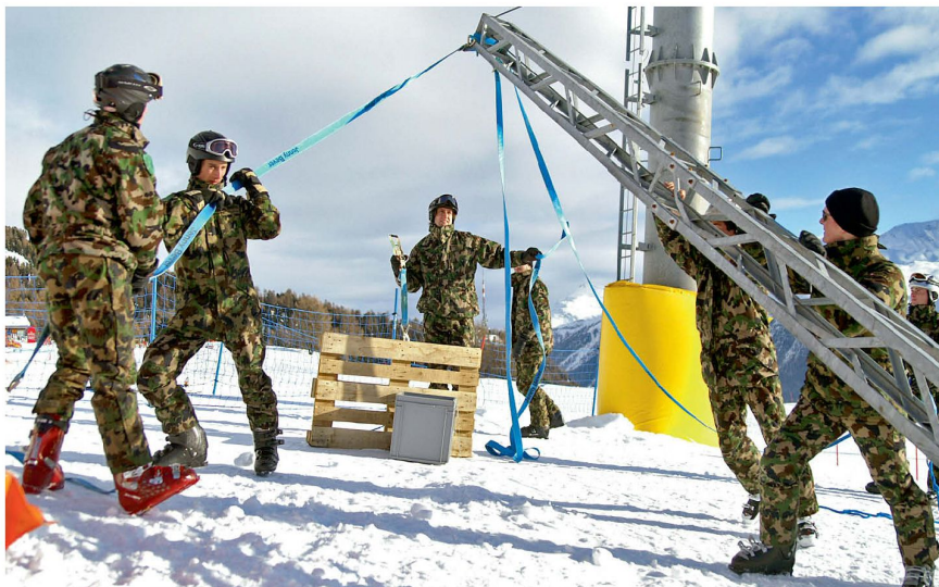
Gemeinsam anpacken: Angehörige der Pz Mw Kp 28/5 helfen bei den Aufbauarbeiten für die Ski-Weltcuprennen der Damen.