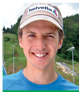
Simon Ammann, Doppel-Olympiasieger, bereitete sich mit WK's auf Vancouver vor.