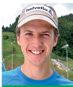
Simon Ammann, Doppel-Olympiasieger, bereitete sich mit WK's auf Vancouver vor.