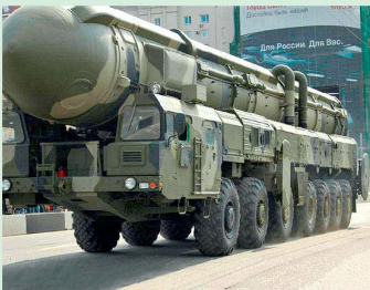
41 Russische Militärdoktrin