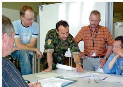
Die erzielten Ergebnisse werden anschliessend genau beurteilt und besprochen.

führung an mehreren Praxisbeispielen geübt und vertieft.