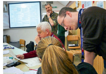
Im Team werden auch die schwierigsten Aufgaben bewältigt.

Der Kurs ist ein erstes Modul aus einer Reihe von drei Führungskursen mit den Schwerpunkten Führungsmethodik, Leadership, Führung im Team und Krisenmanagement, welche in Schaffhausen vorgesehen sind. Er ist Bestandteil des Certificate of Advanced Studies in Communication Management and Leadership des IAM Institut für Angewandte Medienwissenschaft der Zürcher Hochschule für Angewandte Wissenschaften in Winterthur. Durch die Zusammenarbeit mit erfahrenen Lehrkräften der hö-