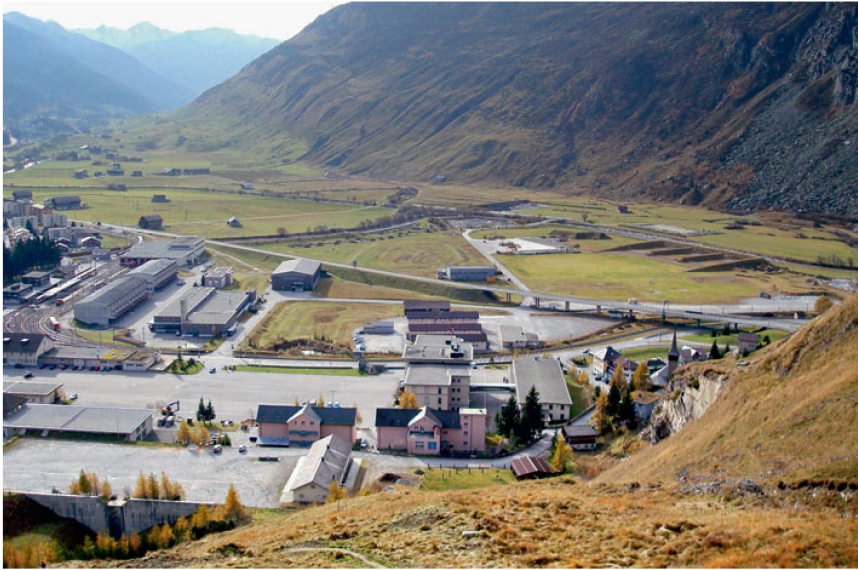
Abb. 2: Von der Gebirgskampfschule zum Tourismusressort: Andermatt als Ausnahmefall

gen der Kantone eine Ansprech- und Koordinationstelle für den Umgang mit dem Dispositionsbestand der armasuisse Immobilien definiert. Bei Zonenplanrevisionen von Gemeinden, die Interesse an der Entwicklung einer Immobilie aus dem Dispositionsbestand haben, wird die aktive Zusammenarbeit gesucht.