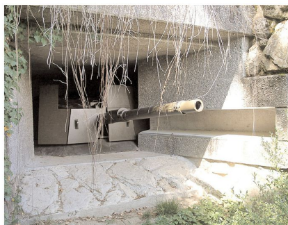
Neueste Anlage: «Centurion-Bunker» im Löwenberg bei Murten. Am Ende des Kalten Krieges erstellt. Turm des Centurion Panzers mit Zusatzpanzerung und Kanone in Feuerstellung.

Im letzten Jahr haben hunderte von Besuchern von diesen Angeboten Ge-