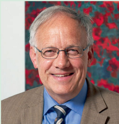
Johann Niklaus Schneider-Ammann