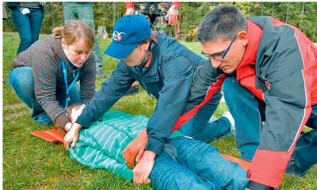
Das richtige Verhalten beim Verdacht von Rückenverletzungen wird unter fachkundiger Anleitung ausgebildet.

Das Ausbildungs- und Ferienlager richtet sich an Jugendliche im Alter von 13 bis 22 Jahren und findet vom 3. bis 10. Oktober 2009 in Schwarzsee (FR) statt. Zu einem gelungenen Lager gehören aber natürlich auch Sport und Spass. dk