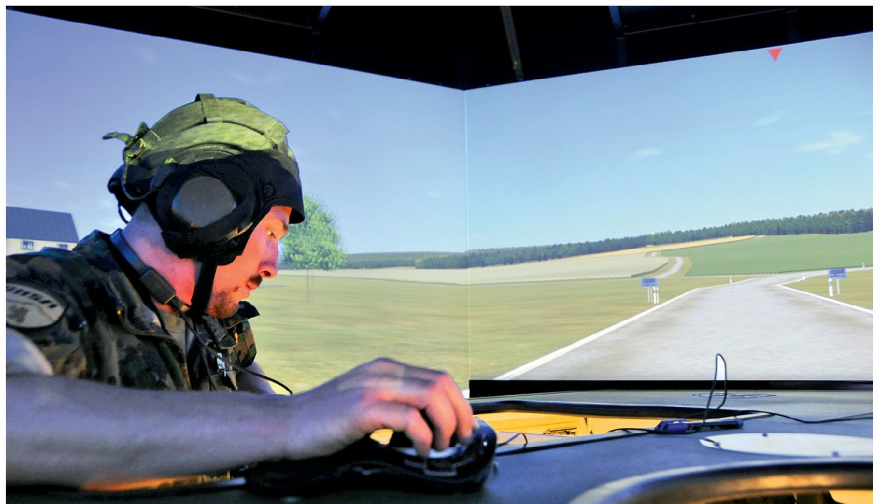
ELTAM: Auf dem Kdo Fz des Bat Kdt. Kdo MAZ

Vom Zfhr bis zum Bat Kdt werden alle Offiziere eines Bataillons im Zweijahresrhythmus in der Führung des Gefechtes der verbundenen Waffen geschult. Es gilt dabei das Motto: «Die Schulung der Führung optimiert die Schulung der Ausführung.» Bat Kdt, Bat Stab und Kp Kdt führen von ihren Kdo Fahrzeugen aus. Die Zfhr befehlen ihren Zug mit allen Gefechtsfahrzeugen sowie abgesessenen Gruppen über eine Eingabehilfe an den Einzelarbeitsplätzen. Eigene wie auch gegneri-