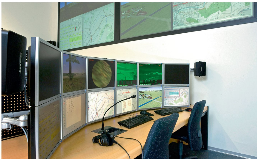
ELSA S: Bedienungs- und Überwachungsstation (BÜS).