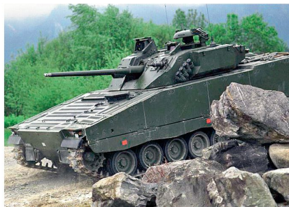
Oberes Bild: Panzer 87 Leopard. Unten: Schützenpanzer 2000.

entscheidend, sowohl in der Aktionsplanung wie in der Aktionsführung qualitativ vollständig über die Mittel der modernen Gefechtsführung zu verfügen. Die gleiche Frage ist für die gefechts-technische Stufe der Zfhr und Grfhr ähnlich zu beurteilen; sie müssen zwingend über die Systeme verfügen können, wollen wir nicht vollends ins «ich räte, hätte, würde» abgleiten.