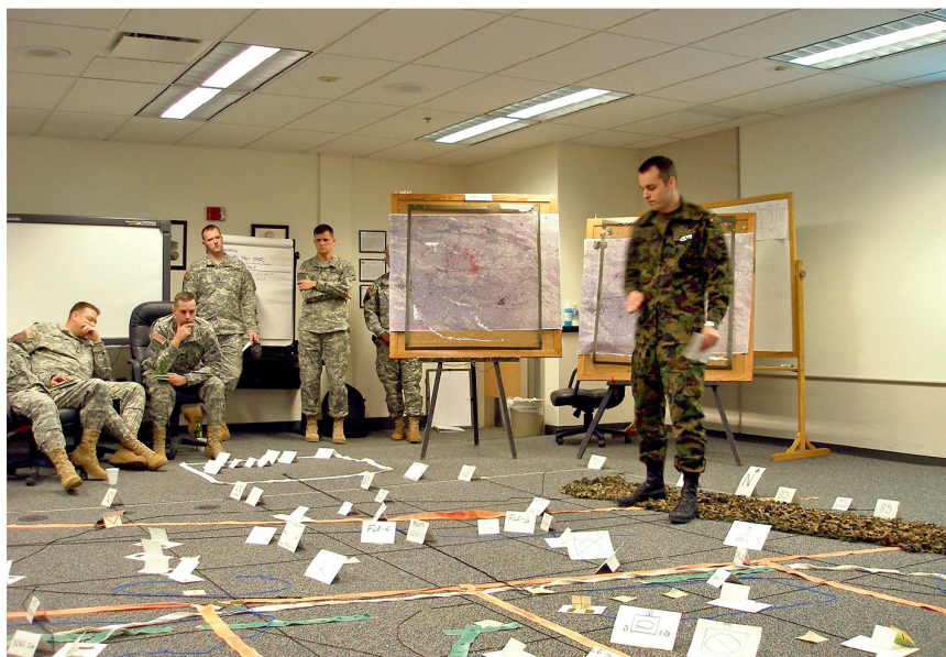
Fort Knox, Février 2007