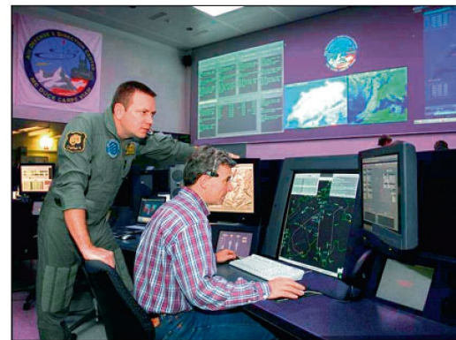
In der Einsatzzentrale Luftverteidigung (EZ LUV) werden die Luftpolizei-Einsätze geführt.

Kooperationsformen beim Luftpolizeidienst dürfen nicht nur unter militärischen Gesichtspunkten und Neutralitätsklauseln betrachtet werden – vielmehr müssen die gleichen Prinzipien wie bei der polizeilichen Zusammenarbeit am Boden angewandt werden. Grund dafür ist nicht zuletzt der Umstand, dass die aktuellen Risiken aus der Luft primär durch nicht-staatliche Akteure entstehen – ein klassisches Charakteristikum polizeilicher Tätigkeitsbereiche. Luftpolizeidienst kann