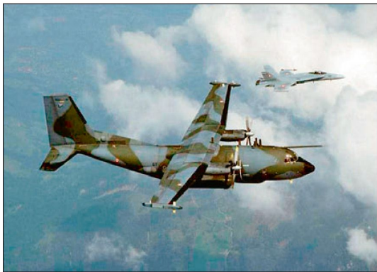
Eine F/A-18 identifiziert ein Transall-Flugzeug.

Räume» durch definierte Entscheidungsträger auf höchster politischer Stufe aufgefangen. Rechtsgelehrte anerkennen wohl die Legitimation solcher Führungsentscheide oberster politischer Stufen, weisen jedoch trotzdem auf die Notwendigkeit einer Klärung hin. Umfassendere Rechtsgrundlagen für den Luftpolizeidienst sind primär nicht für die Gewaltanwendung (Abschuss) notwendig, vielmehr sollten sie die Zuweisung von Verantwortungen und Kompetenzen im Rahmen einer «Public-Privat-Partnership» ermöglichen.