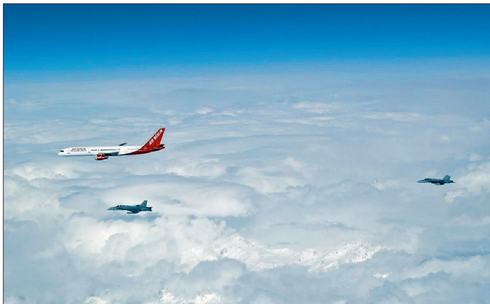
Eine Patrouille F/A-18 identifiziert ein Flugzeug der Air Berlin.

Das Erkennen der Geschehnisse in der Luft wird durch die Arbeit an den zivilen und militärischen Radarbildschirmen gewährleistet. Die permanente Luftraumüberwachung der Luftwaffe (24/7) ermöglicht das Erkennen von Verstössen – Grenz- und Luftraumverletzungen, fehlende «Diplomatic Clearances» etc. Werden solche erkannt, können während den Flugdienstzeiten militärische Mittel zur Identifikation oder für weitere Massnahmen eingesetzt werden. Durch das breite Spektrum möglicher Delinquenten (vom Staats- und Linienflugzeug bis zum Fesselballon) beschränkt sich dabei der Einsatz nicht nur auf Kampfflugzeuge. Auch Lufttransport- und Luftaufklärungsmittel sowie die Sensorik der Flab können wertvolle Beiträge zur Analyse der Luftlage