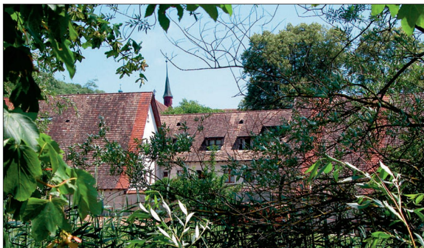
Vor den Toren der Stadt Frauenfeld: Die Kartause Ittingen.

Ideale Voraussetzungen finden die Sportbegeisterten. Den Wassersportlern bieten Hallen-, Sprudel- und geheizte Freibäder ideale Voraussetzungen. In den Sporthallen- und Anlagen der Kantonshauptstadt können auch internationale