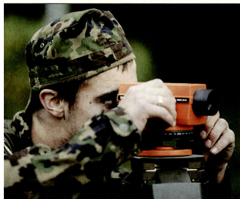
Impressionen aus der Übung Beluga.