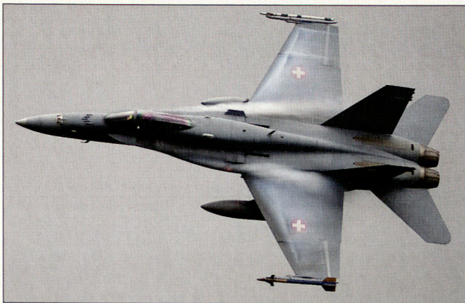
Schweizer F/A-18 über dem Zielgebiet Heuberg.