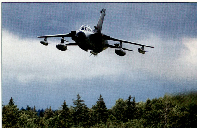
ECR Tornado mit voller EKF-Ausrüstung im Angriff.