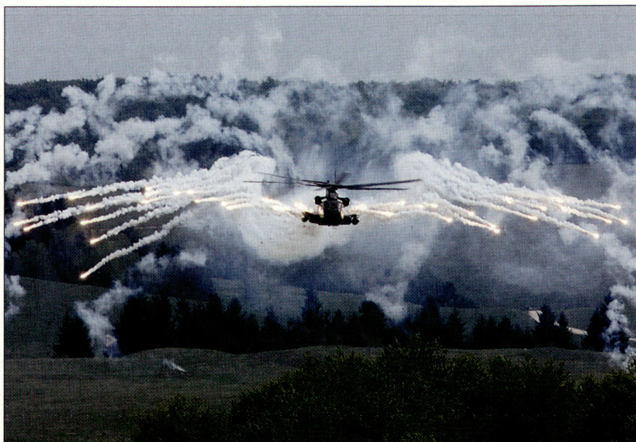
Einsatz von Flares durch deutsche CH-53.

Als weitere Überraschung setzten die Ungarn auch zwei Radartypen ein, die unterschiedlicher nicht sein könnten, nämlich das archaisch anmutende Meterwellenradar SPOON REST, dem die Detektionsmöglichkeit von Stealth-Flugobjekten nachgesagt wird, und das moderne 3D-