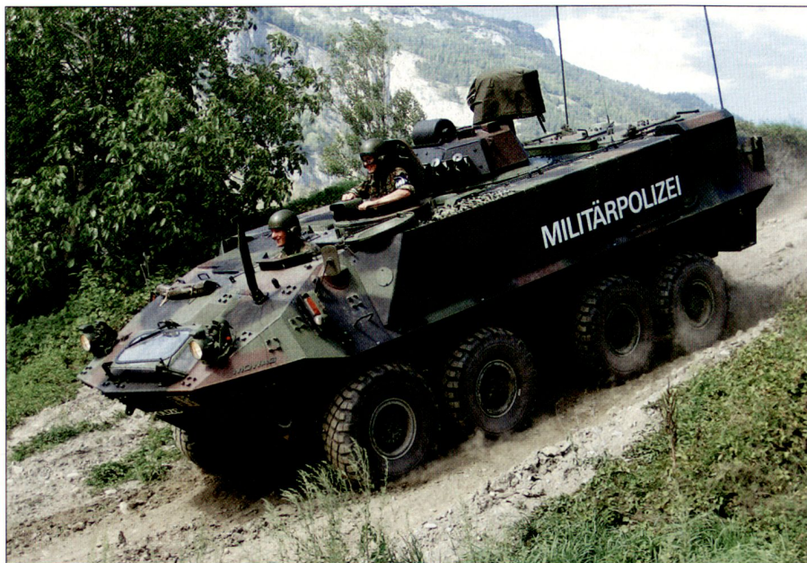
Radschützenpazer der Militärpolizei.

Während zahlreicher Einsätze in den vergangenen Jahren, wie beispielsweise «WSIS» (Objekt- und Konferenzschutz zur Entlastung der Genfer Kantonspolizei anlässlich des UNO-Informations- und Kommunikationssymposiums), «AMBA CENTRO» (Botschafts-, Missions- und Konsulatsbewachungen in Bern, Genf und teilweise Zürich) sowie «AQUA 0805» (Schutz- und Sicherungsaufgaben in Ver-