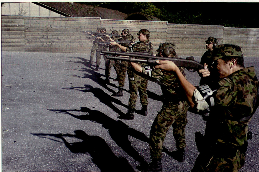
MP-Grenadiere bei der Ausbildung am Polizei-Mehrzweckgewehr.

den in Seiltechniken und im Einsatz mit dem Helikopter geschult.