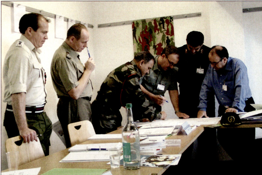
Stabsarbeit im Kurs SWIRMO: Intensive Diskussionen zwischen den Teilnehmern aus Grossbritannien, Polen, Indien und Iran über die Umsetzung des Kriegsvölkerrechts in ihren Armeen.

Die Nachmittage sind für Referate und Diskussionen zu verwandten Themen reserviert, oder es wird eine Exkursion durchgeführt. Zu den Gastreferenten der Nachmittagsveranstaltungen gehören herausragende Persönlichkeiten wie der ehemalige Kommandant der UNO-Truppen in Ruanda, General Dallaire, welcher auf Geheiss der UNO die Vorbereitung und Durchführung des Völkermordes tatenlos beobachten musste, oder die Chefanklägerin des UNO-Tribunals für Ex-Jugoslawien, Carla Del Ponte.