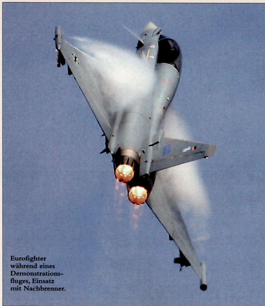
Eurofighter während eines Demonstrations- fluges, Einsatz mit Nachbrenner.

und das Radar, wenn vom Kunden gewünscht, könnte für die Tranche 3 fertig entwickelt werden.