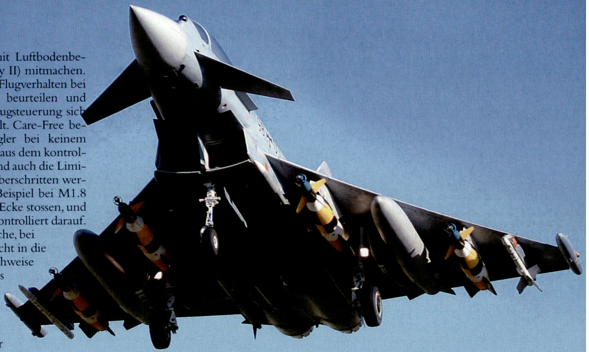
Eurofighter mit Luft-Boden- Bewaffnung, kurz nach dem Start.

Ein weiteres interessantes Projekt waren die ersten Flüge mit dem CAESAR (Captor Active Electronically Scanned Array Radar) im Frühjahr 2007. Das war das erste Mal, dass auf einem Eurofighter ein AESA-Radar eingesetzt wurde. Die Resultate waren äusserst vielversprechend.