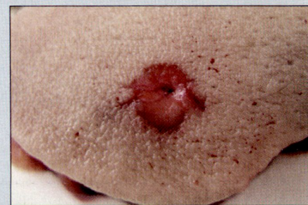
Abb. 4: Ausschuss mit «Schürfsaum» über harter Unterlage.

Wenn Sie nun nach dem Lesen dieser Zeilen und Betrachten der Verletzungsbefunde recht verwirrt sind, hat der Artikel seinen Zweck erreicht. Ich rate nämlich dringendst ab, als Laie selbst eine Schussrichtungsbestimmung vorzunehmen, sondern möglichst bald einen forensisch-