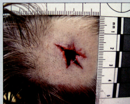
Abb. 3: Ausschuss mit Substanzdefekt.

Gerade hier beim Ausschuss besteht aber die Crux, dass es sehr viele Ausnahmen von dieser Regel gibt. Werden beispielsweise Knochen getroffen, namentlich beim Schädel, so kann auch ein wegfliegendes Knochenstück eine Lücke in die Kopfhaut reissen, was einen Substanzdefekt vortäuscht (Abb. 3). Liegt der Ausschuss einer harten Unterlage auf, oder werden enge Kleider getragen (beispielsweise ein Gürtel), so entsteht auch beim Ausschuss ein Schürfsaum (Abb. 4). Umgekehrt kann es bei einem Einschuss mit aufgesetzter