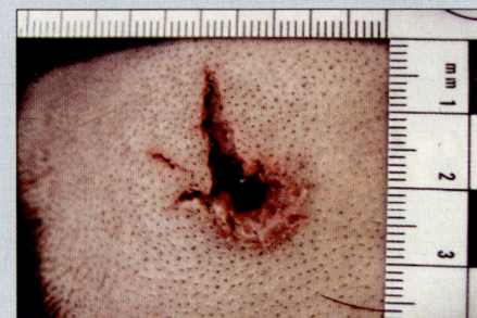
Abb. 5: Einschuss bei aufgesetzter Mündung. Einrisse wie beim Ausschuss.

medizinischen Sachverständigen beizuziehen. Die Diagnose ist für ihn ebenfalls oft schwierig, doch bringt er das Rüstzeug mit, die Ermittlungen auf den richtigen Weg zu leiten. Falls voreilig eine falsche Diagnose gestellt würde, kann eventuell wertvolle Zeit verstreichen, während die Ermittlungen in eine falsche Richtung laufen. Einen medizinischen Schusswaffensachverständigen finden Sie in jedem Institut für Rechtsmedizin (IRM). Die jeder Schweizer Universität sowie die den Kantonsspitalen Chur und St. Gallen angegliederten Institute können Ihnen rund um die Uhr behilflich sein.