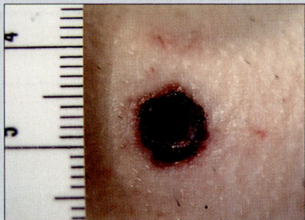
Abb. 1: Typischer Einschuss mit Substanzdefekt und Schürfsaum.

Es sei gleich zu Beginn vorweggenommen, dass die Diagnose von Ein- und Ausschuss für einen medizinischen Laien praktisch unmöglich ist. Auch dem Chirurgen fällt die Diagnostik öfters schwer, sind doch ein Grossteil der uns zugesandten Haut-