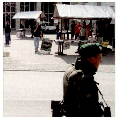
Der einsame Soldat auf Patrouille.

Heute ist das anders. Nicht mehr das Gefechtsfeld mit vorbereiteten Stellungen,