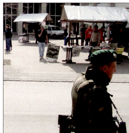
Der einsame Soldat auf Patrouille.

Heute ist das anders. Nicht mehr das Gefechtsfeld mit vorbereiteten Stellungen,