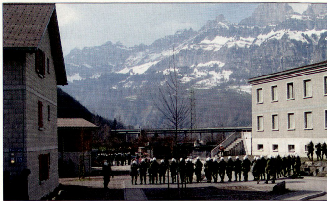
Punktueller Konzentration: Militärpolizei beim Ordnungsdienst.

schlagartig erhöht wird. Ordnungsdienstformationen der Militärpolizei beispielsweise sehen aus wie römische Kohorten, die Soldaten stehen Schulter an Schulter. Dies ist jedoch nicht die Regel, sondern die Ausnahme. Sowohl in der Existenzsicherung als auch in denkbaren Raumsicherungsszenarios ist die Truppendichte weit aus geringer als in der Verteidigung. Das hat Konsequenzen.