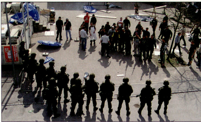
Punktueller Konzentration: Infanterie steht unfreundlicher Menschenmenge gegenüber.