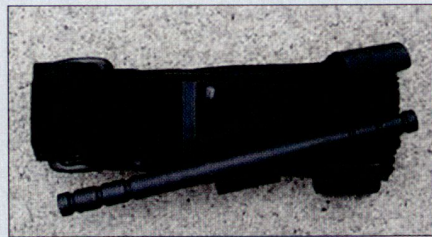
Tourniquet, Abbindmanschette für jeden Soldaten, die eine rasche Blutstillung an den Extremitäten ermöglichen soll.

Dies hat zu einer Neuausrichtung des Sanitätsdienstes geführt, welche auch Ein-