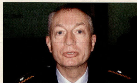
Brigadier Charles Pfister.

Brigadier Pfister legte zuerst die Kräfteverhältnisse dar, wie sie bei Ausbruch des zweiten Libanonkrieges bestanden. Die schwache libanesische Armee umfasste