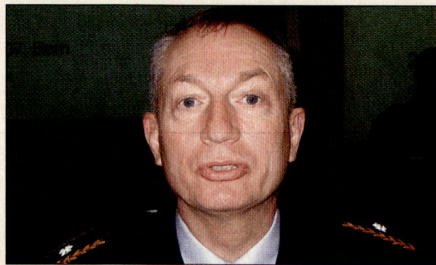
Brigadier Charles Pfister.

Brigadier Pfister legte zuerst die Kräfteverhältnisse dar, wie sie bei Ausbruch des zweiten Libanonkrieges bestanden. Die schwache libanesischen Armee umfasste