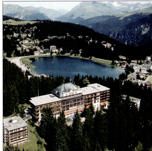
Hier findet das SOG FU FORUM statt: Das renommierte Waldhotel National in Arosa.

Wenn Sie sich vom Programm, von den Referenten und vom ganzen Ambiente angesprochen fühlen, bieten wir Ihnen als