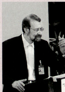
Dr. Ali Laridschani, Chefunterhändler für das iranische Atomprogramm.