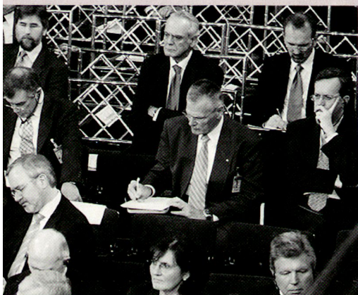
KKdt Christophe Keckeis, Chef der Schweizer Armee.