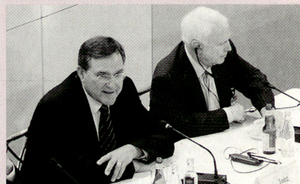
Der deutsche Verteidigungsminister Dr. Franz Josef Jung (links) und der US-Senator John S. McCain, ein Anwärter auf die republikanische Präsidentschaft 2008.

Blick in den Saal des Hotels Bayrischer Hof, dem jährlichen Veranstaltungsort der Konferenz für Sicherheitspolitik. Im Parterre nehmen jeweils die zu Voten berechtigten Teilnehmer Platz, während die Emporen den Beobachtern gehören.