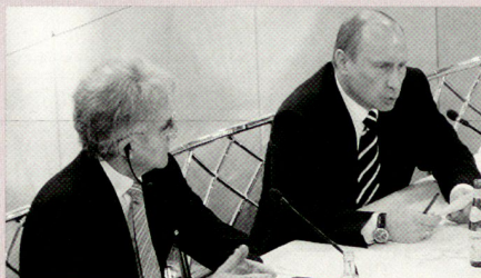
Der verdienstvolle Organisator und Gastgeber Prof. Dr. h.c. Horst Teltschik (links), ehemals Berater von Kanzler Kohl, und der russische Präsident Wladimir Putin, ehemals Angehöriger des KGB.