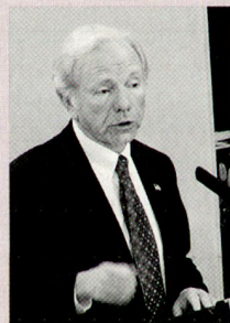
Der frühere demokratische US-Senator Joe Lieberman (Connecticut), der 2006 als Unabhängiger wieder in den Senat gewählt wurde. Er und McCain sind regelmässige Teilnehmer in München.