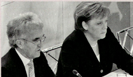
Prof. Dr. h.c. Horst Teltchik und Bundeskanzlerin Angela Merkel.