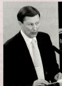
Der russische Verteidigungsminister und ehemalige KGB-Mitstreiter von Präsident Putin, Sergej Iwanow. Dieser gilt auch als Kronfavorit bei der Nachfolge von Putin.