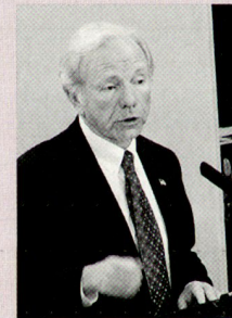
Der frühere demokratische US-Senator Joe Liebermann (Connecticut), der 2006 als Unabhängiger wieder in den Senat gewählt wurde. Er und McCain sind regelmäßige Teilnehmer in München.