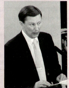
Der russische Verteidigungsminister und ehemalige KGB-Mitstreiter von Präsident Putin, Sergej Iwanow. Dieser gilt auch als Kronfavorit bei der Nachfolge von Putin.