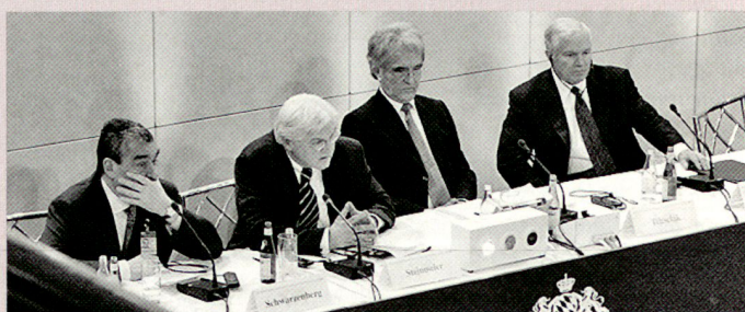
Podiumsdiskussion mit dem tschechischen Aussenminister Schwarzenberg, dem deutschen Aussenminister Steinmeier, Prof. Dr. h.c. Teltschik und US-Verteidigungsminister Gates (v.l.n.r.).