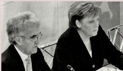
Prof. Dr. h.c. Horst Teltschik und Bundeskanzlerin Angela Merkel.