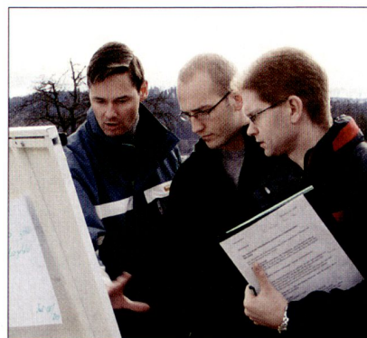
Praktische Arbeit im Gelände.

Die Arbeit war vorwiegend praktisch. Die gefechtstechnischen Entschlüsse wurden im Gelände ausserhalb und im Zentrum von Winterthur erarbeitet. Sie wurden mit drei Exposés bereichert: «Der Polizeikompass –