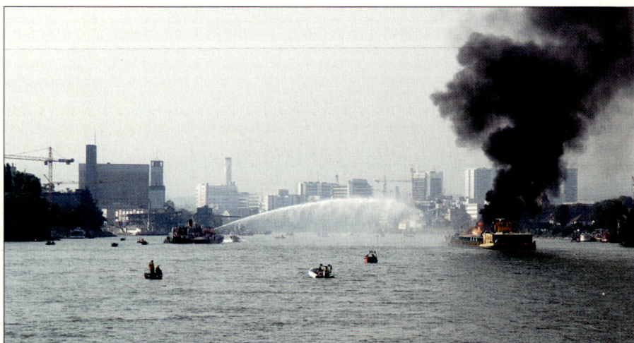
Feuerlöschboot «Christopherus» stellt sich schützend vor das Passagierschiff.