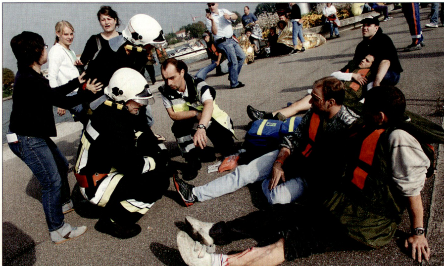
Betreuung von verletzten Passagieren auf französischer Seite.

Der Bereich Sicherheit musste bei der Vorbereitung der Übung besonders beachtet werden, da die Übung auf und teilweise unmittelbar am Rhein stattfand. Es wurde daher eine Vielzahl von Massnahmen ergriffen, um die Gefahrenpotenziale herabzusetzen und um Unfälle und Ereignisse zu verhindern. Neben einer Sperrung der Rheinschifffahrt wurden zwei Sanitätshilfsstellen betrieben und Rettungsboote und Taucher eingesetzt. Dabei kamen neben weiterem Personal 40 Angehörige der Schweizer Armee zum Einsatz. Zu erwähnen ist, dass sich während der Übung kein nennenswerter realer Unfall ereignet hat.