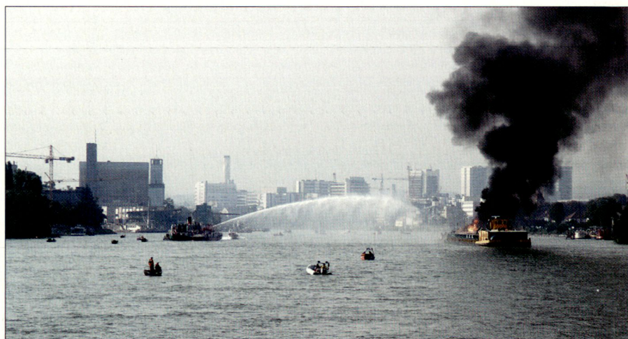
Feuerlöschboot «Christopherus» stellt sich schützend vor das Passagierschiff.