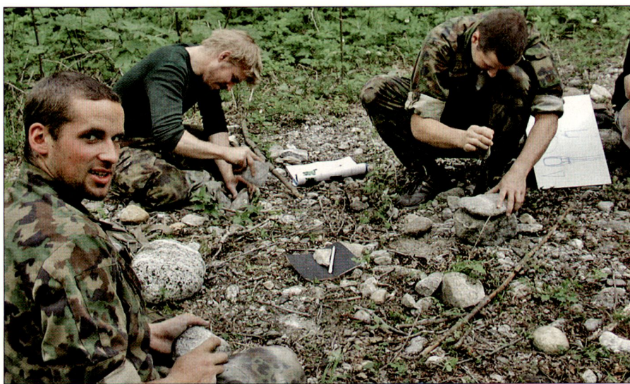
Wichtiges Survival-Handwerk: Steinbearbeitung.

Überlebenskompetenz erfordert Wissen. Es ist erfreulich, dass mit 15% des zeitlichen Aufwandes bereits 85% der notwendigen Wissensinhalte im Bereich Überleben ausgebildet werden können. Die Vermittlung der verbleibenden 15% des Wissens benötigt also mehr als fünf Mal länger. So kann auch in begrenzter Unterrichtszeit eine wirkungsvolle Grundlage für Überlebenskompetenz gelegt werden. Das notwendige Wissen für eine solide Überlebensausbildung ist riesig, und die Auswahl von Ausbildungsinhalten muss sorgfältig und bewusst erfolgen. Zudem reicht es nicht, aus einem Buch über Überlebensstechniken vorzulesen und anzunehmen, Überlebenskompetenz sei dann ausgebildet. Eine umfassende