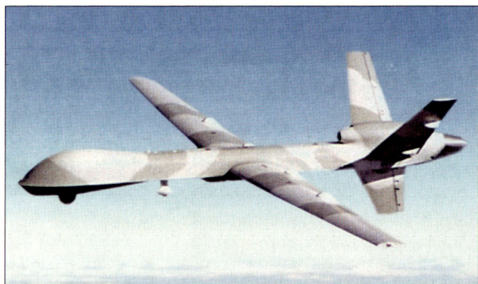
Das Drohnensystem MQ-9 «Reaper» soll primär für die Bekämpfung zeitkritischer Ziele genutzt werden.

Aus heutiger Sicht wäre ein begrenzter iranischer Raketenangriff gegen US-Einrichtungen oder auch gegen symbolisch wichtige Ziele in der Region, dies als Reaktion auf einen ausländischen Militärschlag gegen das iranische Nuklearprogramm, am ehesten denkbar. hg