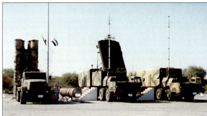
Komponenten des russischen Luftverteidigungssystems S-300 PMU anlässlich einer Rüstungsausstellung.

verteidigungssystem aufzubauen. Im Wesentlichen sollen dabei Systeme vom Typ S-300PS zu Einsatz gelangen. Diese strategisch nutzbaren Luftverteidigungssysteme werden vom russischen Rüstungskonzern Almaz-Antey hergestellt und werden auch seit Jahren unter der Bezeichnung S-300 PMU auf dem internationalen Rüstungsmarkt angeboten. Die Reichweite dieser Flab-Lenk Waffen soll etwa 150 km und die maximale Bekämpfungshöhe von Luftzielen rund 27 km betragen. hs