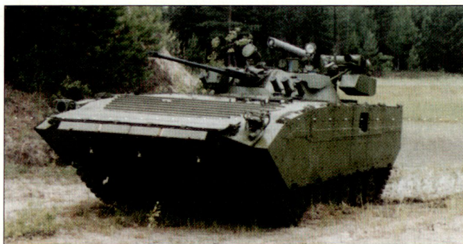
Priorität bei den russischen Landstreitkräften hat weiterhin die Modernisierung vorhandener Waffensysteme (Bild: modernisierter Schützenpanzer BMP-2M).

Wertmässig dürften dabei die Nuklearstreitkräfte zusammen mit den kosmischen Truppen einmal mehr am meisten profitiert haben. Bei den strategischen Raketenstruppen wurden weitere silogestützte SS-27 «Topol-M» in Dienst gestellt, sodass unterdessen ein strategisches Raketenregiment vollständig damit ausgerüstet sein soll. Im Herbst 2006 konnte zudem die erste mobile «Topol-M» den Truppen übergeben werden. Die Flugkörper des Raketen systems SS-27 werden von den Rüstungswerken Votkinskij in der Wolgarepublik Udmurtien produziert. Nebst wei-