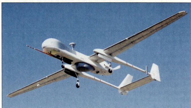
Ergänzend zu den taktischen Drohnensystemen «DRAC» beschaffen die französischen Streitkräfte auch UAVs vom Typ «Eagle-1» (Bild).

samt 160 taktischen UAV-Systemen DRAC (Drone de Reconnaissance Au Contact) vor, die für den Aufklärungsbedarf des französischen Heeres vorgesehen sind. Die Auslieferung soll bereits in diesem Jahr beginnen. Mit dem als «lenkbares Fernglas» funktionierenden unbemannten Luftaufklärungssystem DRAC können Tag und Nacht Bilder in Echtzeit beschafft und laufend verarbeitet