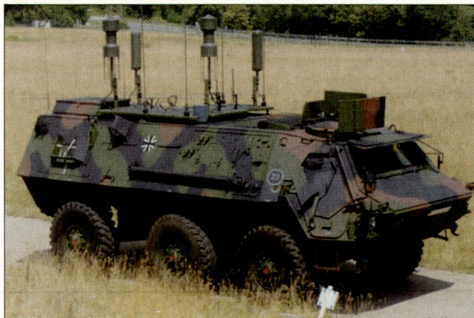
Prototyp eines Störsenders gegen ferngesteuerte Sprengfallen auf einem gepanzerten Transportfahrzeug «Fuchs».

Aktuell werden darüber hinaus auch Störsender realisiert, mit deren Hilfe einzelne Fahrzeuge oder auch Konvois gegen die Wirkung von funkferngesteuerten Sprengfallen geschützt werden. Auf den Frequenzen, die von gegnerischen Kräften für Funkfernsteuerungen genutzt werden können, wird ein entsprechend hoher Störpegel erzeugt, sodass in einem bestimmten Umkreis um diese Störfahrzeuge platzierte Sprengfallen kein Zündsignal empfangen und somit unwirksam werden. Die neuen Störmittel sollen künftig die deutschen Truppen in Krisenregionen vor allem gegen IEDs (Improved Explosive Devices) schützen. hg