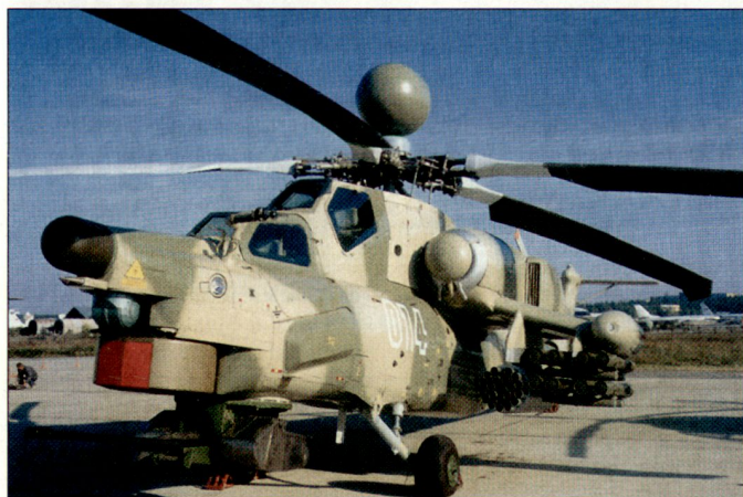
Mit grosser Verzögerung wurden im Jahre 2006 den russischen Luftstreitkräften die ersten Kampfhelikopter Mi-28N zugeführt.

Der mittlerweile mehrfach überarbeitete Zeitplan der JSF-Entwicklung sieht nun in diesem Jahr Erstflüge für die Variante F-35A und F-35B vor. Als letzte wird die F-35CV ihren Erstflug vermutlich erst 2009 absolvieren. Auf Grund erheblicher Gewichtsprobleme und der technischen Herausforderungen bei der F-35B haben sich erhebliche Verzögerungen im Programmverlauf ergeben. Dies bedeutet, dass mit der Einführung der ersten Serienmaschinen erst nach 2012 zu rechnen ist. Der Streitkräfteausschuss des amerikanischen Senats votierte daher Ende 2006 für eine weitere Verschiebung der Serienproduktion. Ausserdem wurde auf die angebliche