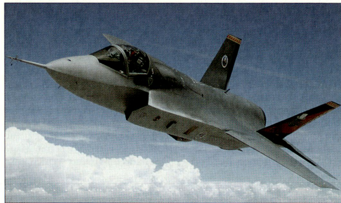
Beim JSF-Programm dürften weitere Verzögerungen unumgänglich sein.

Die US Army hat in Vicenza die 173rd Airborne Brigade stationiert, die eine wichtige autonome Krisenreaktionskraft dieser Region darstellt. hg