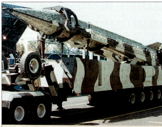
Von der ballistischen Boden-Boden-Lenk Waffe «Shahab-3» (Bild anlässlich einer Militärparade) existieren verbesserte Versionen mit grösserer Reichweite.

Die neue Aufgabe des UAV-Systems «Reaper» wird bei der US AF mit «Hunter/Killer» umschrieben. Darunter wird die rasche Aufklärung und nachfolgende zielgenaue Bekämpfung zeitkritischer Ziele verstanden. Die 42nd Attack Squadron verfügt vorerst über rund 10 «Reaper»-Systeme, bei Vollbestand sollen später rund 20 Systeme vorhanden sein. hg