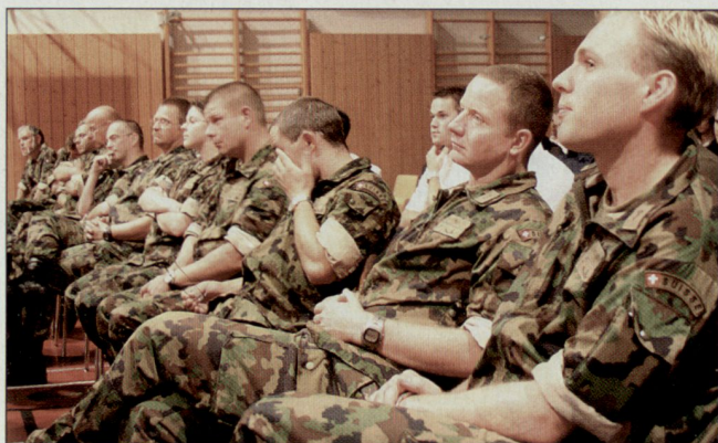
Berufskader der Log OS.