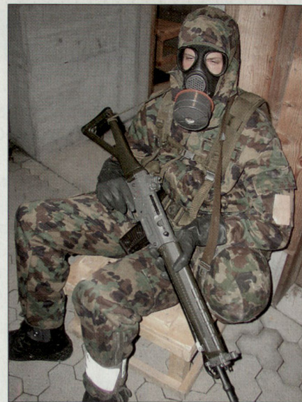
Schlafen und Wache mit Schuma.

Ausserhalb von Ilanz wartete, nach einem kurzen Marsch, das Essen auf uns. Ungekocht, versteht sich. Verschiedenes Gemüse, Maiskörner und fünf Hasen pro Klasse warteten darauf, gekocht, gebraten und frittiert zu werden. Nach einer Stunde Kochzeit war es so weit. Eine, für die meisten, unerwartet gute Mahlzeit war bereit zum Verschlingen. Unglaublich, wie diese kleine Aufgabe unser ganzes Team noch