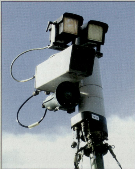
Er sieht bei Tag und Nacht weiter und besser – Mast mit Sensoren des Überwachungssystems 98.

könnte an der sichtbaren Armeepresenz Anstoss nehmen oder sich gar ängstigen. Tatsächlich schätzt eine Mehrheit selbst der betroffenen und mitunter gestörten Anwohner den militärischen Botschaftsschutz –, von überwiegender Ablehnung keine Spur, wie eine wissenschaftliche Erhebung zeigt. 3 Höchstens bedingt scheint die Bevölkerung die rechtlich und politisch durchaus begründbare Skepsis ihrer Behörden zu teilen, wie sie nach wie vor dem militärischen Botschaftsschutz gilt.