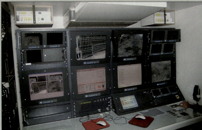
Arbeitsplatz des Überwachungssystems 98.

lose Zusammenarbeit ein, von der Planung über das Einholen der Behördenentscheide bis zur Durchführung. Nichts hat in den letzten Jahrzehnten die Sicherheitskooperation so vorangebracht wie das WEF und die sporadisch in unserem Land – oder wie der G8-Gipfel hart an der Landesgrenze – veranstalteten internationalen Konferenzen. Das System unserer inneren Sicherheit gleicht einem in seinem Chitinpanzer gefangenen Krebs, der immer wieder nur eine kurze Weile lang wachsen kann, wenn er sich gerade gehäutet hat. Die beschriebenen Grossanlässe decken gnadenlos Mängel auf und erzwingen rasch einen Entwicklungsschub. Die Öffentlichkeit nimmt das kaum wahr; der verbreitete Eindruck des Stillstandes täuscht mitunter, zum Glück.