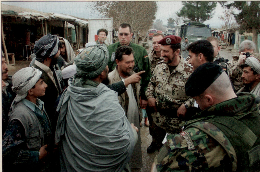
Schweizer Beitrag zur Gesprächsaufklärung in Afghanistan.