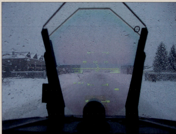
Blick durch das Head-up-Display einer Hornet: Der Pilot rollt im Schneetreiben von der Kaverne zur Piste. Spezielle Wetter-situationen machen die Operationen in Meiringen anspruchsvoll, aber sehr interessant.

Nach der Landung wird das Flugzeug nicht wie sonst üblich auf einem grossen Abstellplatz oder Hangar von den Mechanikern erwartet. Nach meinem Wissen ist die «Meiringer Variante» weltweit einmalig: