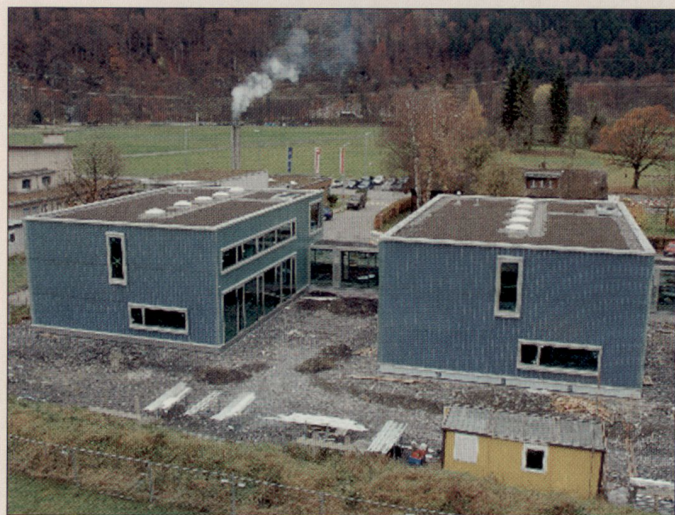
Rechts das Staffelgebäude, links das Ops-Gebäude. Im Hintergrund ist der Eingang zur Kaverne sichtbar.

Weitere Informationen über die Fliegerstaffel 11 finden Sie im Internet unter www.fliegerstaffel11.ch