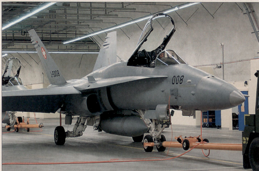
Die Hornets werden zurück zum Standplatz gezogen. Der Pilot sitzt immer noch im Cockpit.

Die Hornets rollen zurück zur Kaverne, wobei das erste Flugzeug direkt in den Vorstollen hineinrollt. Es wird im wahrsten Sinne des Wortes vom Berg verschluckt. Nach dem Abstellen der Triebwerke werden die Hornets von Schlepptraktoren zu ihren Standplätzen gezogen. Hier werden sie von der Ground Crew für einen weiteren Einsatz bereitgestellt. Wohlgerne, alles in der Kaverne.