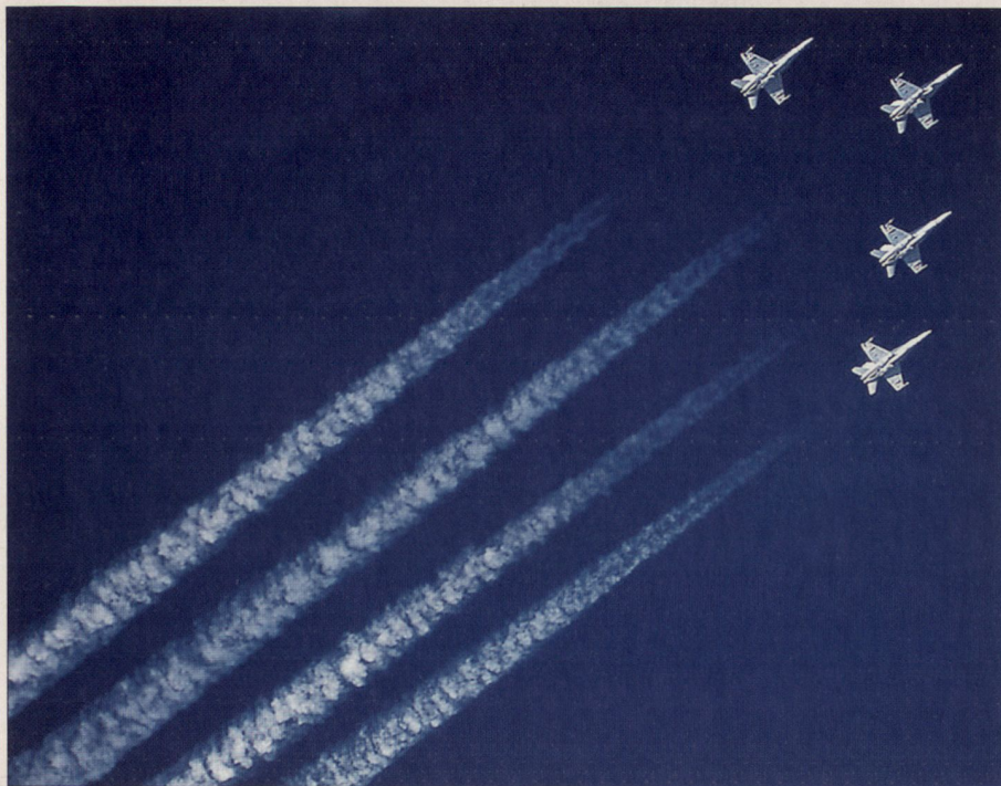
Vier F/A-18 mit Kondensstreifen bilden das BFK-Logo.