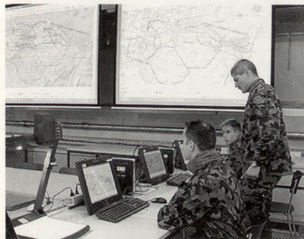
Das Bild des traditionellen KP hat sich in den letzten Jahren erheblich verändert. Computer dominieren, erübrigen aber nicht das Gespräch.

realisiert werden (Layer-, Filterdefinition), sollte aber auch bei der Interpretation von Sensorinformationen möglich sein. Abweichungen von geplanten Abläufen oder Erreichen von Bestandes- und Zeitlimiten werden vom System selbstständig erkannt und dem Nutzer in Form von Alarmmeldungen zur Verfügung gestellt. Durch die Fähigkeit des FIS zur vertikalen Informationsverbreitung müssen solche Meldungen bis auf die Stufe der Einsatzgruppe/Fahrzeug verfügbar gemacht werden.