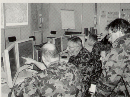
Analyse von Fakten und Nachrichten – nach wie vor eine der Hauptaufgaben der Stabsoffiziere.

Der Aktionsführungsprozess basiert in wesentlichem Umfang auf visualisierter Information und automatisierten Alarmen, welche im Tactical Operation Centre (TOC) als Entscheidungsgrundlagen verfügbar sein müssen. Für die erfolgreiche zeitgerechte Informationsführung innerhalb des TOC ist es entscheidend, dass Sensorinformationen respektive verdichtete Informationen aus den Führungsgrundgebieten (FGG) in der richtigen Qualität dem TOC verfügbar gemacht werden.