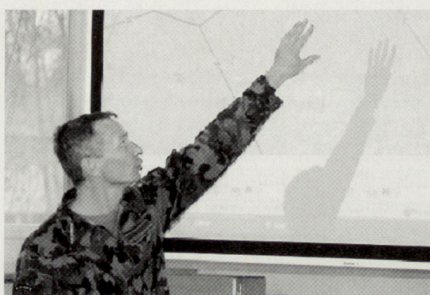
Kommunikation – unerlässliche Tätigkeit von Kommandant und Stabsangehörigen. (links Kdt Geb Inf Br 10)

Im Bereich des Aktionsplanungsprozesses muss hervorgehoben werden, dass in erster Linie Grundlageninformationen erforderlich sind, aufgrund derer die Entscheidungskriterien für die Entschlussfassung entwickelt werden können. Diese Grundinformationen müssen jedoch in regelmässigen Abständen der Ist-Situation angepasst werden, damit auch Folgeplanungen auf der korrekten Ausgangslage basieren. Die à-jour-Haltung der Grund-