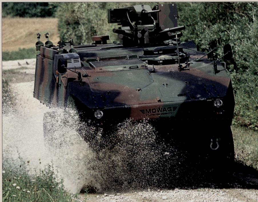
Piranha IIIC 8x8 Radschützenpanzer der belgischen Armee.

Der Piranha III wurde 1997 offiziell vorgestellt und in den vergangenen Jahren aufgrund der stetig gestiegenen Kundenanforderungen laufend weiterentwickelt. Angesichts der zunehmend asymmetrischen Bedrohungsszenarien erstaunt es nicht, dass die Hauptforderungen der Kunden den Schutz gegen Minen und ballistische Waffen betreffen. Aktuell werden denn auch die Schutzsysteme im Hinblick auf improvisierte Explosionskörper und so genannte «Roadside Bombs» optimiert. Hier profitiert das Traditionsunternehmen von den langjährigen Erfahrungen im Bereich Minenschutz. Der Piranha III 8x8 bietet Schutz gegen die meisten proliferierten Minentypen der Welt. Im Gegensatz zu anderen Anbietern verlassen wir uns bei der Überprüfung des Minenschutzes nicht ausschliesslich auf Computersimulationen, sondern haben den Minenschutz mit über 100 Echtversuchen am System erprobt.