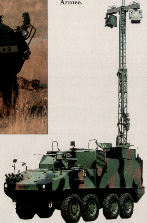
PIRANHA III C 8x8 «RAP Pz» der Schweizer Armee.

In den kommenden Jahren stehen bei einigen Armeen grössere Beschaffungsvorhaben für geschützte Radfahrzeuge an. Die Mowag ist überzeugt, mit dem Piranha III 8x8 auch in Zukunft den Standard in dieser Fahrzeugklasse zu setzen. ■