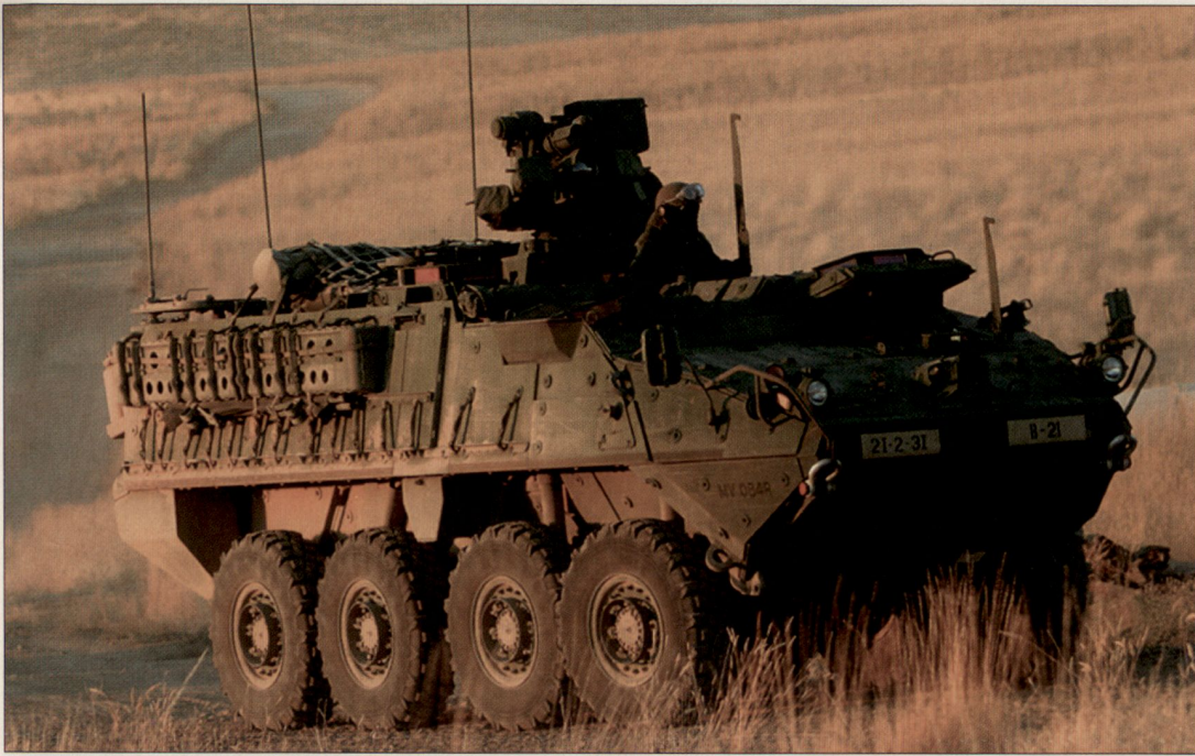
«Stryker» der U.S. Army auf Basis des PIRANHA IIIH 8x8.