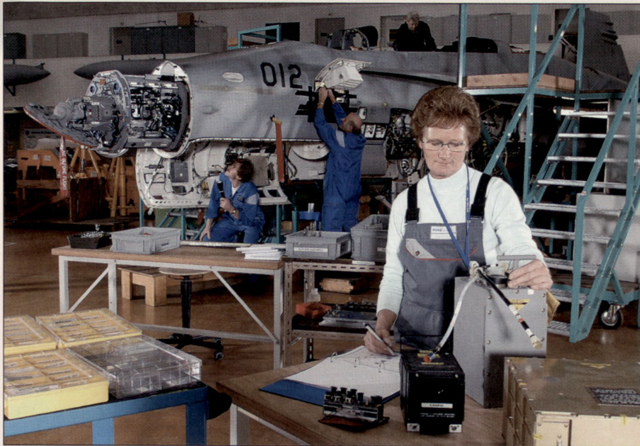
Für das F/A-18-Ergänzungsprogramm mussten in der RUAG Aerospace in Emmen zahlreiche Geräte eingebaut werden.

erweitert werden. Zudem muss die Avionik für den Einsatz von AIM-9X ergänzt werden, was primär durch eine Aufdatierung der Software erfolgt.