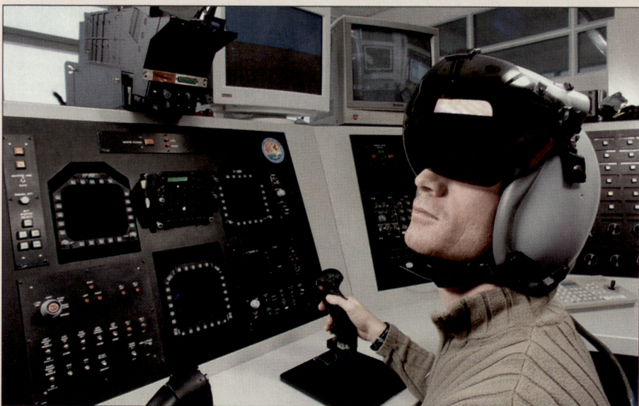
Im Avionik-Labor der RUAG Aerospace in Interlaken werden Tests mit dem neuen Helmvisier durchgeführt.

Wie bei der Realisierung der ersten Phase ist auch in der zweiten Phase die RUAG Aerospace in Emmen als Unterauftragnehmerin für den Einbau der neuen Systeme verantwortlich. Das beinhaltet sämtliche Modifikations- und Einbauarbeiten, die einen bedeutenden Eingriff in die komplexen Flugzeugsysteme darstellen. Die RUAG Aerospace hat schon die Endmontage der F/A-18-Flotte und die erste Phase der Ergänzungen durchgeführt. Mit dem Umbau des ersten F/A-18 wurde im Februar 2006 begonnen – der Erstflug ist für Juni 2006 geplant. Laut Planung soll die «Ergänzung der Ausrüstung für Kampfflugzeug F/A-18», Phase 2, im Herbst 2009 abgeschlossen werden. ■