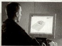
CUA - Computerunterstützte Ausbildung