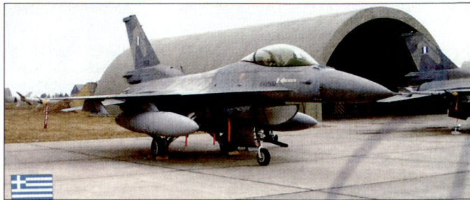
Die griechischen Streitkräfte verfügen bereits heute über Kampf Flugzeuge F-16.

weitere 30 Flugzeuge vom Typ F-16 der neusten Generation, die von den USA zu vorteilhaften Bedingungen angeboten werden, gekauft werden. Die bis März 2004 in Griechenland regierenden Sozialisten hatten seinerzeit den Kauf von 30 europäischen Kampf Flugzeugen Eurofighter «Typhoon» vorgesehen. Gemäss Aussagen der neuen Regierung wurden diese Pläne sisiert, weil die Beschaffung amerikanischer F-16 wesentlich günstiger zu stehen komme. Nebst neuen Kampf Flugzeugen wollen die griechischen Streitkräfte auch 333 Kampfpanzer «Leopard 2» aus