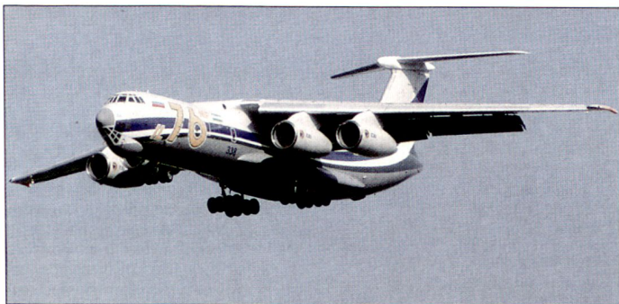
Russische Transportflugzeuge vom Typ Il-76 «Candid» stehen weltweit in zivilen und militärischen Versionen im Einsatz.