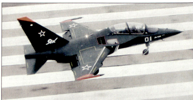
Die russische Luftwaffe hat sich für das Trainingsflugzeug Yak-130 entschieden.

stimmt. Dies obwohl gewisse Kreise in der russischen Militärführung weiterhin auch das Konkurrenzprodukt MiG-AT ins Auge gefasst haben. Unterdessen stehen einige wenige Prototypen des Typs Yak-130 für Testzwecke zur Verfügung. Eine offizielle Bestellung ist bisher ausgeblieben. Nun soll für 2006 die erste Tranche des dringend benötigten Trainingsflugzeuges budgetiert und beschafft werden. Die Yak-130 soll sowohl für die Grundschulung als auch das fortgeschrittene Training der russischen Piloten genutzt werden. hg