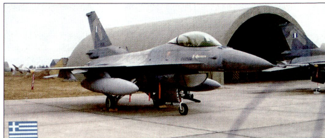
Die griechischen Streitkräfte verfügen bereits heute über Kampfflugzeuge F-16.

weitere 30 Flugzeuge vom Typ F-16 der neusten Generation, die von den USA zu vorteilhaften Bedingungen angeboten werden, gekauft werden. Die bis März 2004 in Griechenland regierenden Sozialisten hatten seinerzeit den Kauf von 30 europäischen Kampfflugzeugen Eurofighter «Typhoon» vorgesehen. Gemäss Aussagen der neuen Regierung wurden diese Pläne sistiert, weil die Beschaffung amerikanischer F-16 wesentlich günstiger zu stehen komme. Nebst neuen Kampfflugzeugen wollen die griechischen Streitkräfte auch 333 Kampfpanzer «Leopard 2» aus