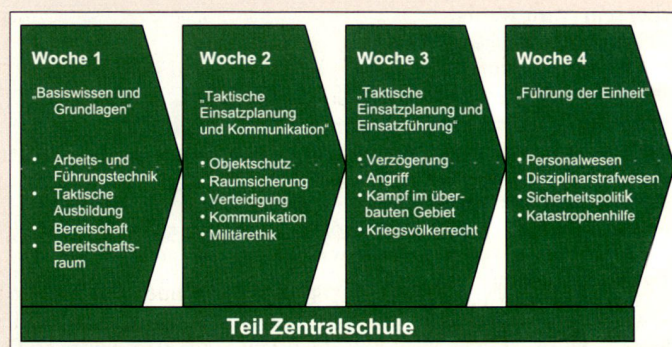
Lehrinhalte im FLG I